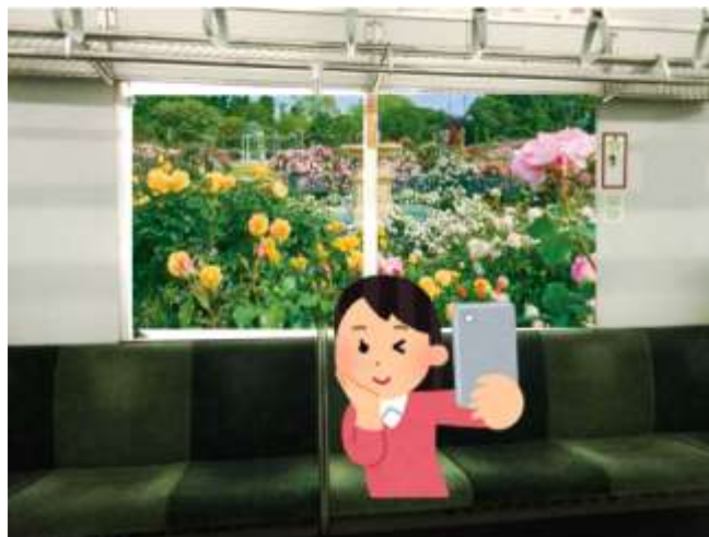
(3) フォトスポット (イメージ)