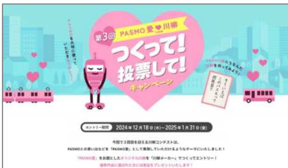
(キャンペーンサイトイメージ)

皆さまそれぞれの「PASMO 愛」あふれる作品のエントリーをお待ちしております。